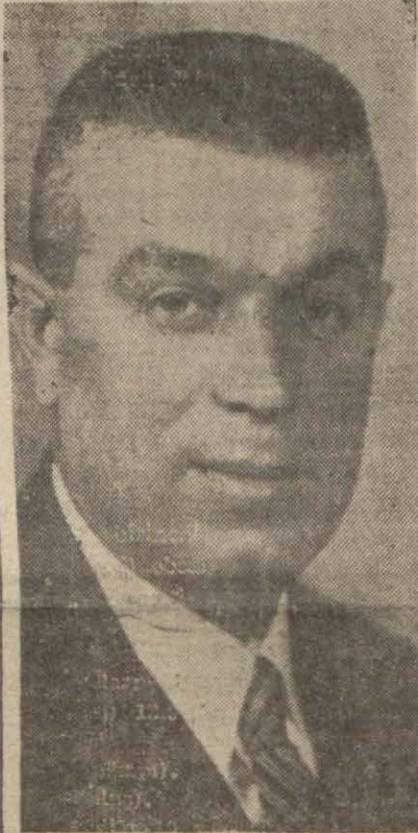
Doktor Behçet Uz

Ankara 17 (A.A.) — Ticaret Vekili Behçet Uz bu akşam radyoda aşağıdaki konuşmayı yaptı: Sayın vatandaşlarım, (Devamı 5 inci sayfada)