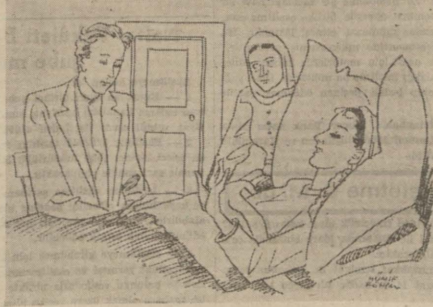
Nihayet bir gün, bir ziyaret günü...

O zaman vahsi bir ask tuğyanı ile Ali onu çekti: — Yalnız benim, yalnız benim... diye boğuk bir sesle sanki uludu ve birden hiç bir zaman yapmadığı; her dakika yapmak ihtiyacıyla kıvrılırken kendisine müsaade etmediği bir hareketle yüzünü sevgilisinin yüzüne vaktirdi. Ağzı ağıza geldiler, Fato birden bütün gençli-